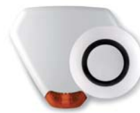
Sirenas exterior/interior inalámbricas.